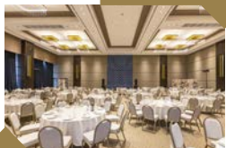
WEST JOURNEY 143 M 2